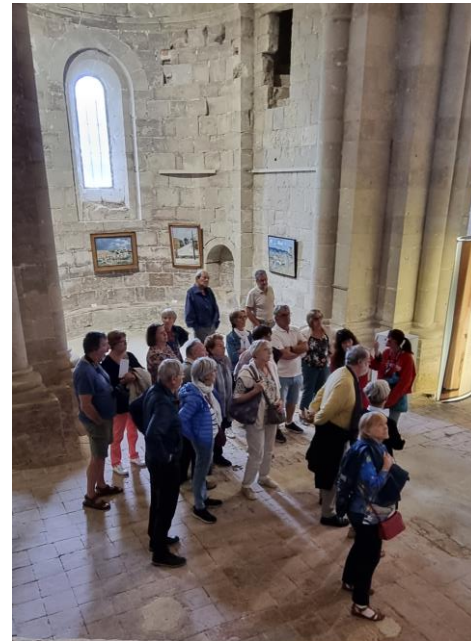
Le cloître de l'abbaye