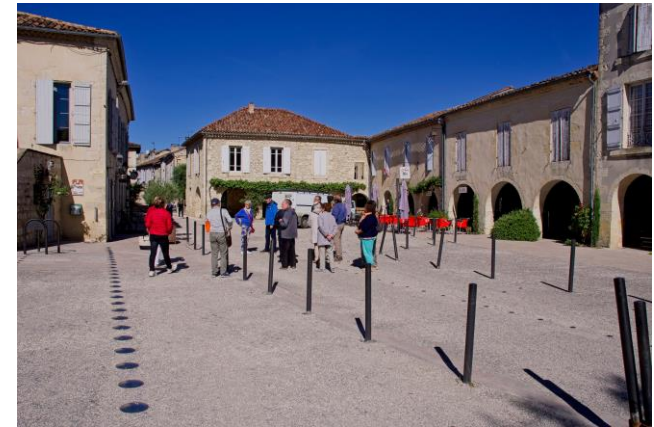
La Romieu, belle bastide