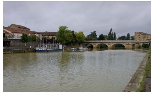
Repas et balade au bord du D'Artagnan sur la Baïse