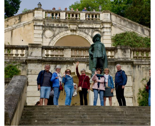
Les escaliers monumentaux