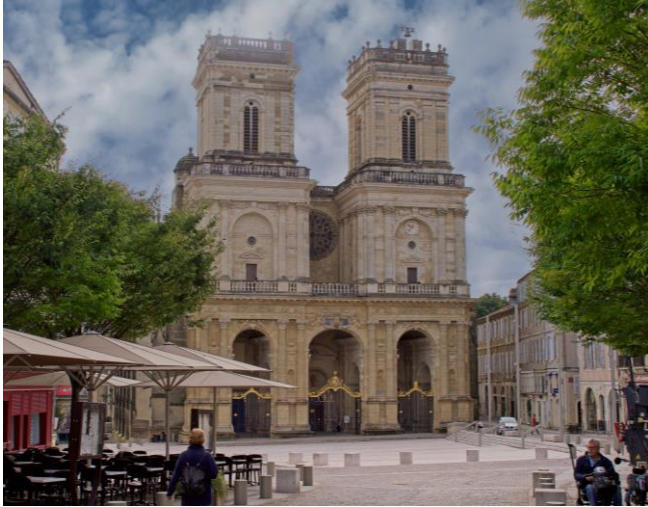
La Cathédrale d'AUCH, site classée UNESCO au titre des Chemins de St Jacques