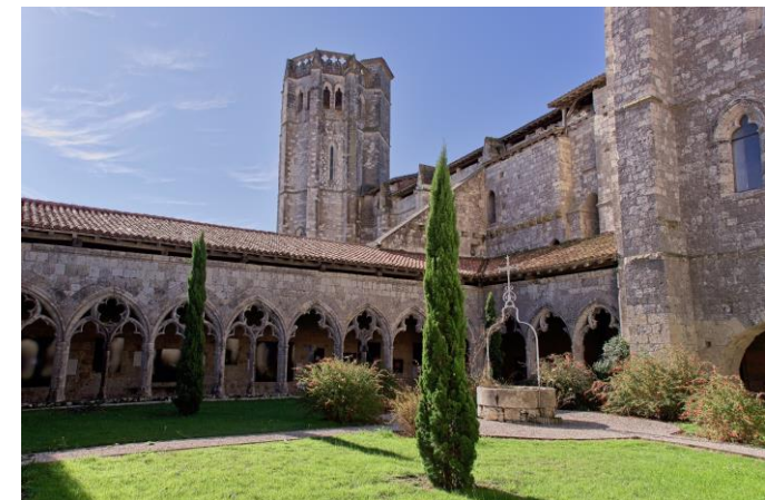
Le cloître de la collégiale de La Romieu, autre site classé UNESCO