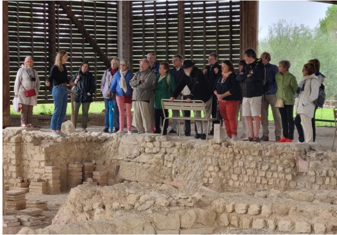
Visite guidée de la Domus de Cieutat d'Élusa, riche maison gallo-romaine

Eauze, capitale de l'Armagnac, fut la capitale de la province romaine de Novempopulanie