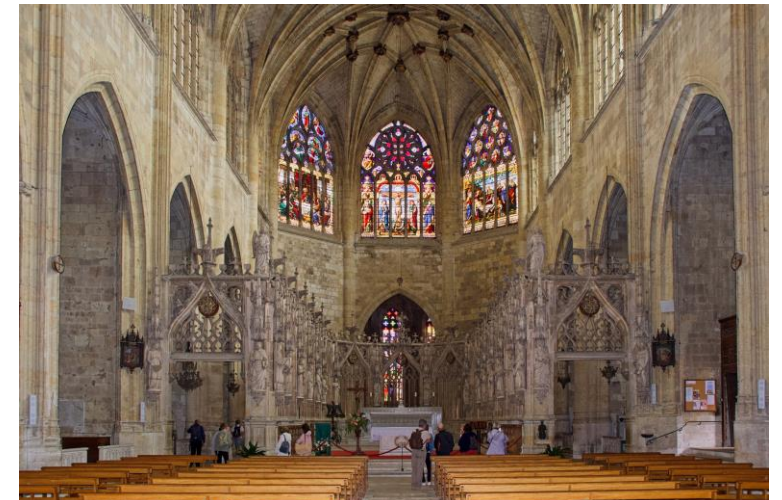
Le chœur et la nef