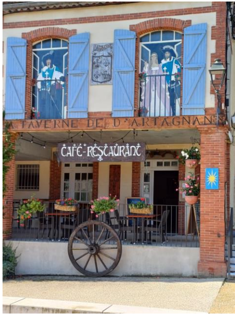
Lupiac, village de caractère, berceau de d'Artagnan