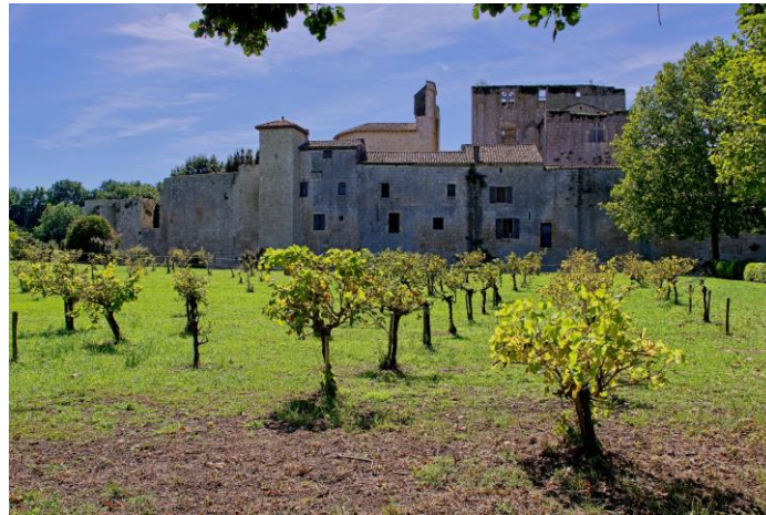
Larressingle, la petite Carcassonne du Gers