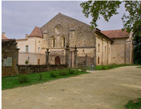
L abbaye cistercienne de Flaran