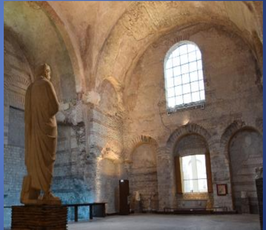
Thermes romain au musée de Cluny