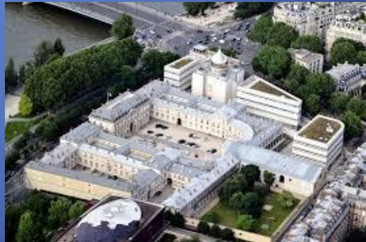
Palais de l'Alma et cathédrale de la Sainte Trinité