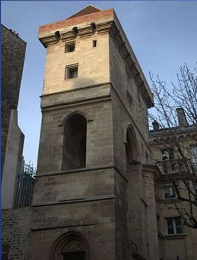
Tour Jean sans peur