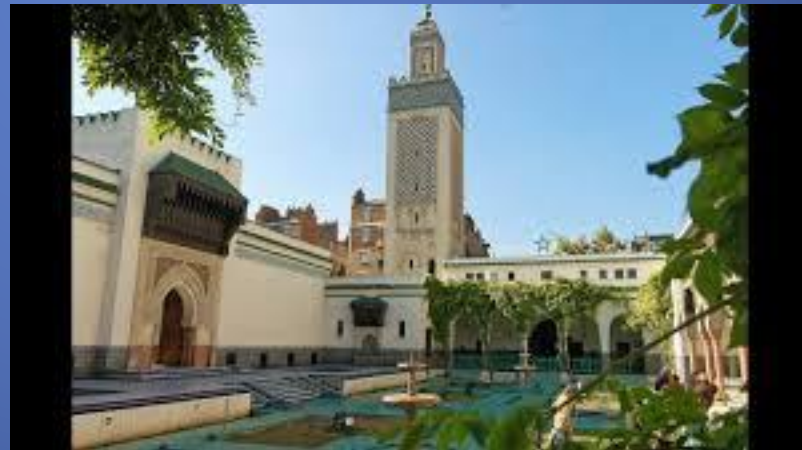
La grande mosquée de Paris