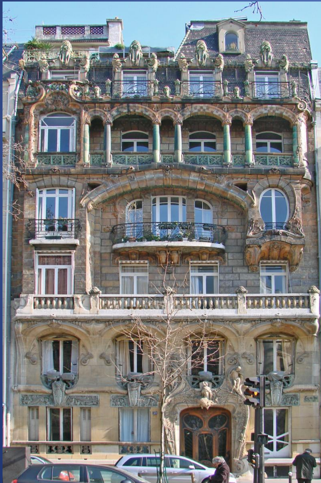
Immeuble Art Déco