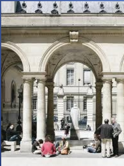
Collège de France