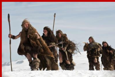
Photo extraite du film de Jacques MALATERRE, « Ao, le dernier Néandertal »

...n'est pas un job facile. Souvent harassés et chargés comme des mulets, en déplacement d'un endroit à un autre, nos collègues se réunissent dans les endroits les plus improbables (abris sous roches, musées, salles des fêtes) en petits groupes (oserait-on dire en meutes ?), cheveux au vent, l'air perdu parfois... Ai-je raté l'heure ? Suis-je dans la bonne salle ?