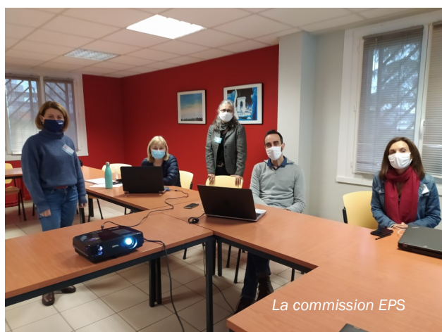
La commission EPS